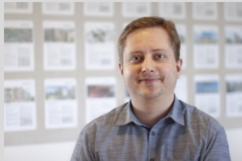
Tilsyn, konstruktioner Martin Niedzwiecki Wissenberg