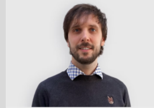
Tilsyn, arkitekt Kasper Thaarup Nordicarch