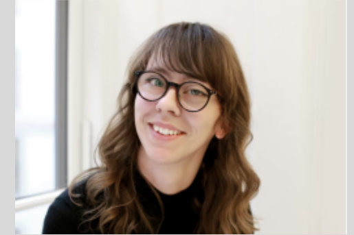
Tilsyn, landskab Ditte Haslev Nordicarch